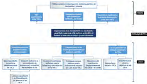
Árbol del problema