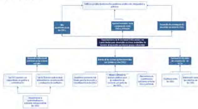
Árbol de Objetivos.

Para llegar a esto, se tomó en cuenta el análisis que se realizó en el Diagnóstico ya mencionado y las alternativas que se plasmaron en él.