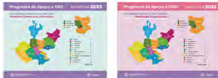
Figura 3 y 4. Resultados de OSC beneficiadas por el programa por tipo de apoyos. Ejercicio 2023.

Para el año 2022 se operaron 03 modalidades del Programa que fueron: Coinversión y Oncológica en el tipo de apoyo económico y Capacitación como apoyo en servicios, presentando los siguientes resultados, mismos que fueron distribuidos en las diversas regiones en las que se cuenta con OSC en el Estado y de conformidad al cumplimiento de los criterios y requisitos de elegibilidad que en el ejercicio se simplificaron para mayor participación de las organizaciones.