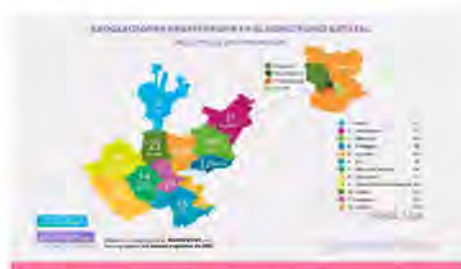
Figura 1: OSC registradas en el Directorio Estatal de Instituciones de Asistencia Social de la Secretaría del Sistema de Asistencia Social por regiones, Noviembre 2023.

Por su parte, el Directorio Estatal de las Instituciones de Asistencia Social, a cargo de la Subsecretaría para el Desarrollo y Vinculación con Organizaciones de la Sociedad Civil, tiene registradas en la misma temporalidad un total de 1,235 organizaciones, reconocidas por el Consejo Jalisciense de Asistencia Social, distribuidas en las áreas de: Bienestar social (504), Asistencia infantil (106), Educación (106), Gerontología (88), Rehabilitación y Educación Especial (254), Servicios Médicos (160), Ambiental (17) 5 .